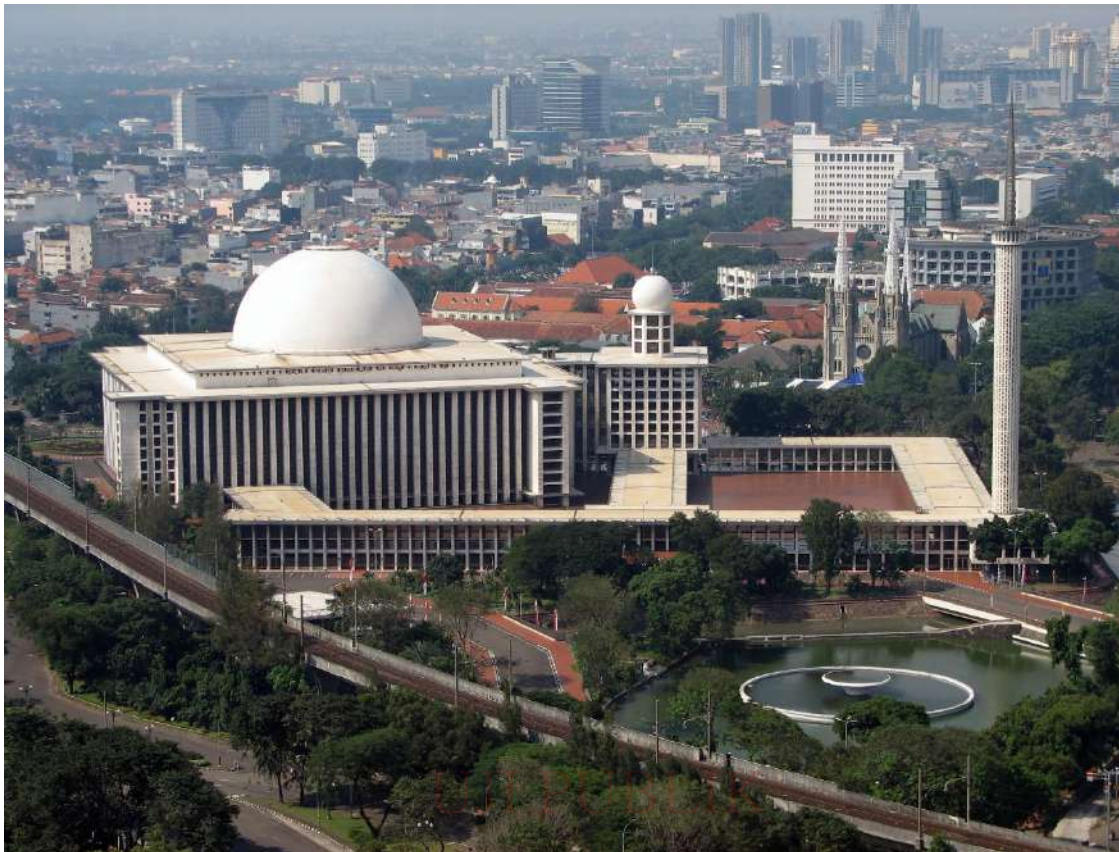
Masjid Istiqlal di Jakarta