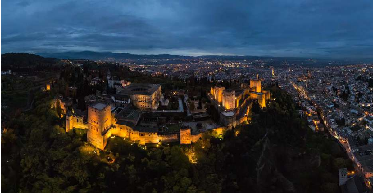
Istana Al-Hambra : Granada - Spanyol

Kemerosotan politik dalam Islam sebenarnya sudah dimulai sejak runtuhnya Daulah Abbasiyah di Baghdad. Di lain tempat Daulah Bani Umayyah di Andalusia juga mulai meredup pasca munculnya Muluk al-Thawaif (kerajaan-kerajaan kecil) sampai dengan berakhirnya kekuasaan Bani Ahmar. Praktis, setelah runtuhnya Daulah Abbasiyah dan Umayyah tidak ada kerajaan-kerajaan Islam yang besar di dunia.