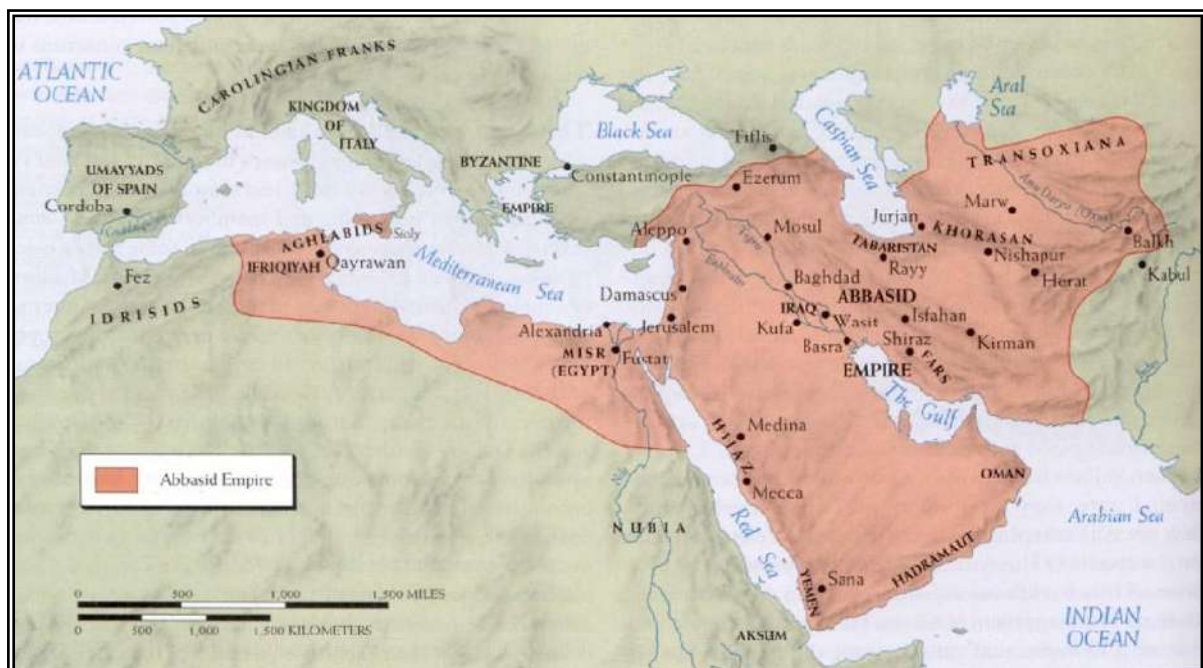
Peta Wilayah Kekuasaan Daulah Abbasiyah